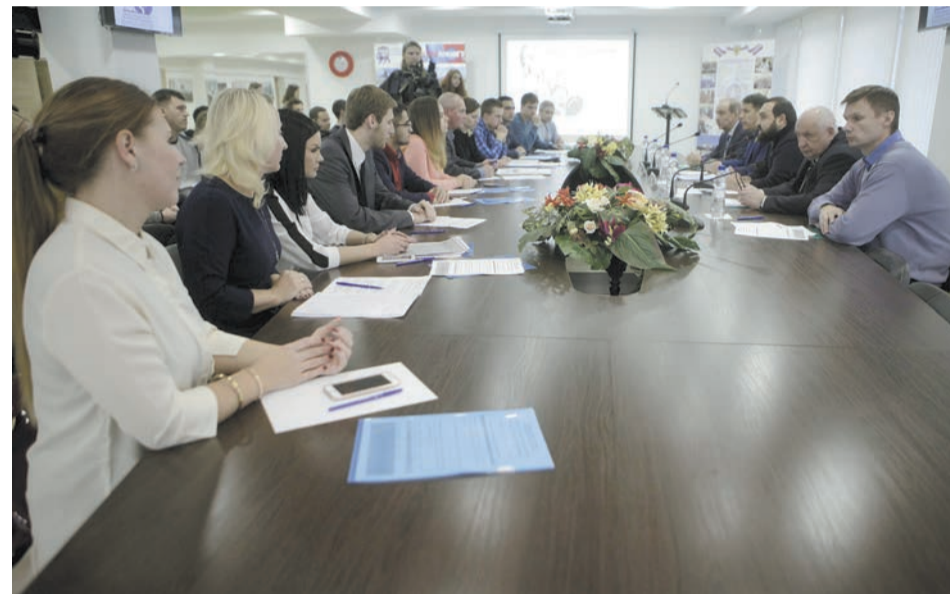
Такие встречи планируют проводить регулярно.

Студенты ПсковГУ повысили правовую грамотность в рамках проекта Общественной палаты РФ